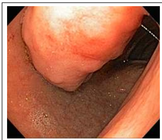
Figura 1. Cara anterior del bulbo duodenal con lesión protruyente, de pedículo grueso, lobulada, de superficie irregular y erosionada, de 3 cm de diámetro

El estudio histológico reveló una masa constituida por glándulas de Brunner separadas por tabiques de tejido fibromuscular y vasos sanguíneos (figura 3).